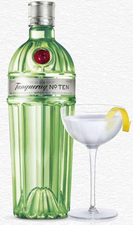
Martini No. Ten